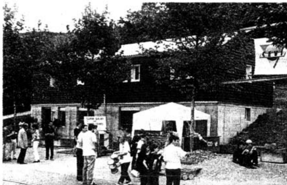
Mit der Casa Blu ist ein lange gehegter Wunsch in Erfüllung gegangen.

Nachdem von der Nachbarorganisation Zurzach ebenfalls die besten Wünsche und ein Präsent für die Kücheneinrichtung der Casa Blu überbracht worden