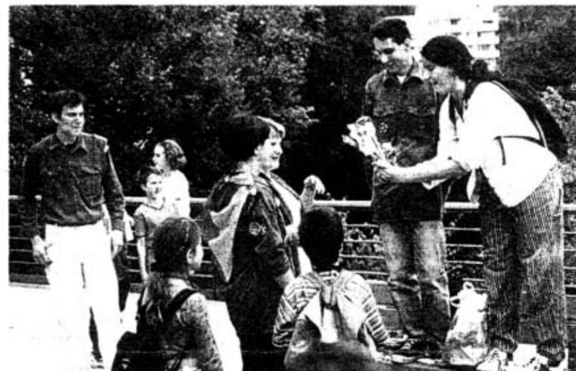
Die Nachbarorganisation Zurzach überbringt ein Präsent.